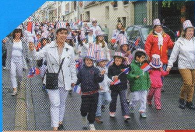
ARRÊT SUR IMAGES Commemoration du 8 mai