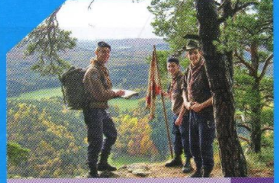
VIE ASSOCIATIVE Raid antique pour les Randscouts